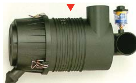
Twee fasen luchtreiniger met weerstands-indicator voor toepassingen met hoge stof-concentratie

voorgereinigde lucht stroomt door het hoofdelement