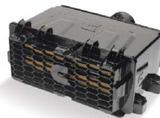
Meest geavanceerd: Direct Flow™ Luchtinlaat-Systeem