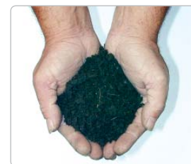
1 gram stof per pk is al voldoende om een motor ernstig te beschadigen

! Cummins Filtration levert een complete reeks luchtfilterelementen voor vervanging, zowel met PU als met conventionele metalen eindplaten. Hiermee worden de vele varianten in filterontwerpen op de markt afgedekt. Daarnaast biedt onze brede productlijn een serie luchtreinigerbehuizingen van composietmateriaal en van metaal, aangevuld door accessoires zoals slangen, klemmen, beugels, afdekkappen enz.