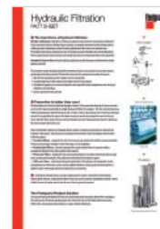
Hydraulische filtratie LT36182